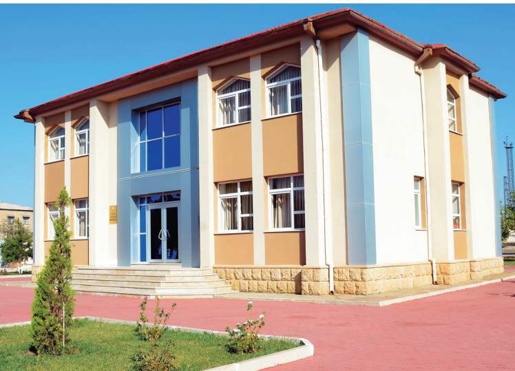
Culfa rayon prokurorluğunun inzibati binası