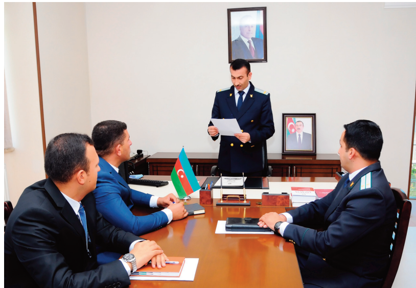
Kəngərli rayon prokurorluğunda keçirilmiş tədbirin iştirakçıları Naxçıvan Muxtar Respublikasının Prokurorluğu