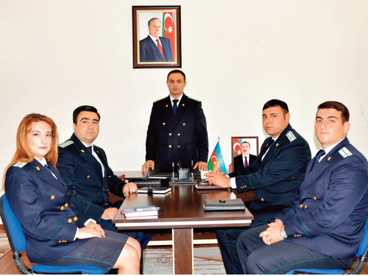
Şarur rayon prokurorluğunda keçirilmiş tədbirin iştirakçıları