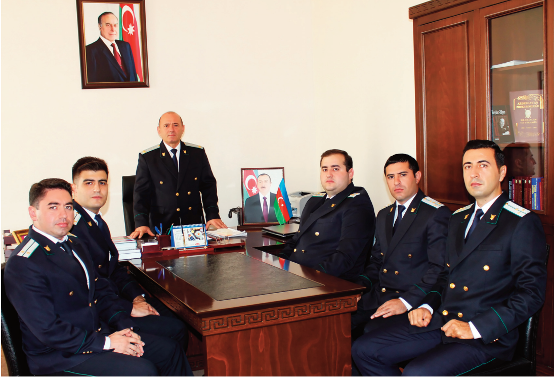
Naxçıvan şəhər prokurorluğunda keçirilmiş tədbirin iştirakçıları

Azərbaycan Prokurorluğunun yaranmasının 100 illik yubileyi münasibətilə avqustun 28-də Naxçıvan şəhər prokurorluğunda, sentyabrın 4-də Babək rayon prokurorluğunda, sentyabrın 12-də Culfa rayon prokurorluğunda, sentyabrın 14-də Kəngərli, Şahbuz, Şərur rayon prokurorluqlarında, sentyabrın 15-də Sədərək rayon prokurorluğunda, sentyabrın 17-də Ordubad rayon prokurorluğunda seminarlar keçirilib.