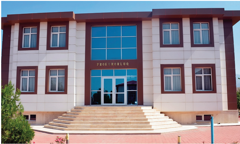
Sadarak rayon prokurorluğunun inzibati binası