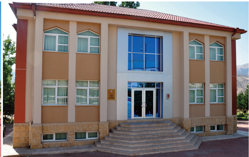
Şahbuz rayon prokurorluğunun inzibati binası