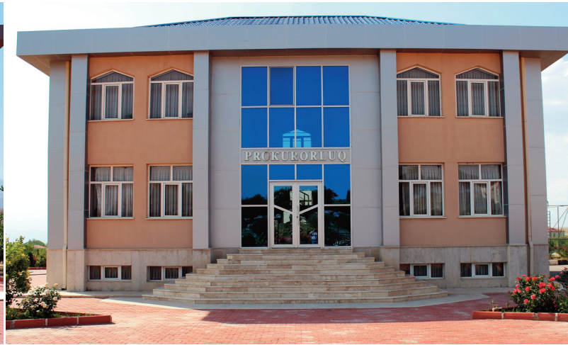
Kəngərli rayon prokurorluğunun inzibati binası