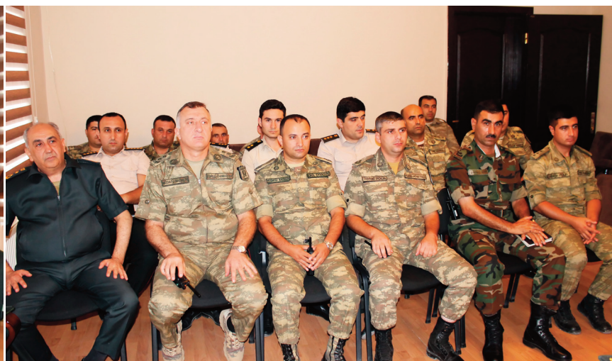
Qarabağ hərbi prokurorluğunda keçirilmiş tədbirin iştirakçıları