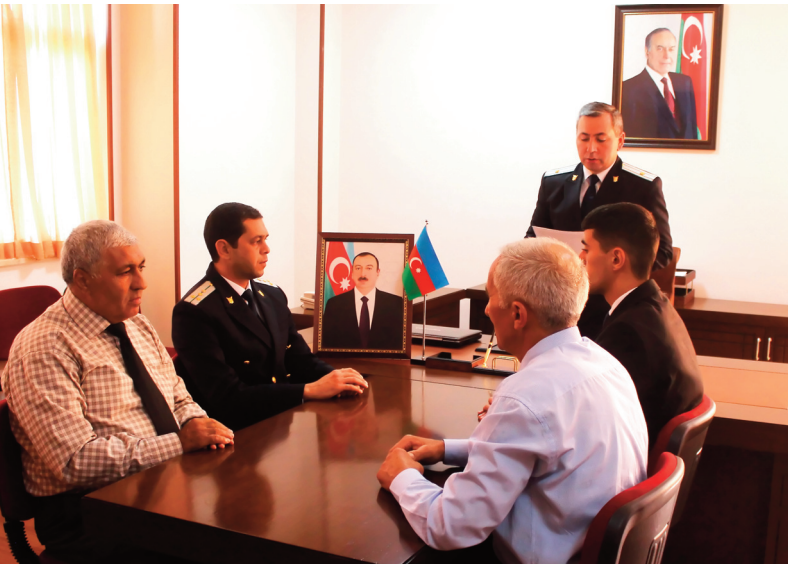
Sadərak rayon prokurorluğunda keçirilmiş tədbirin iştirakçıları