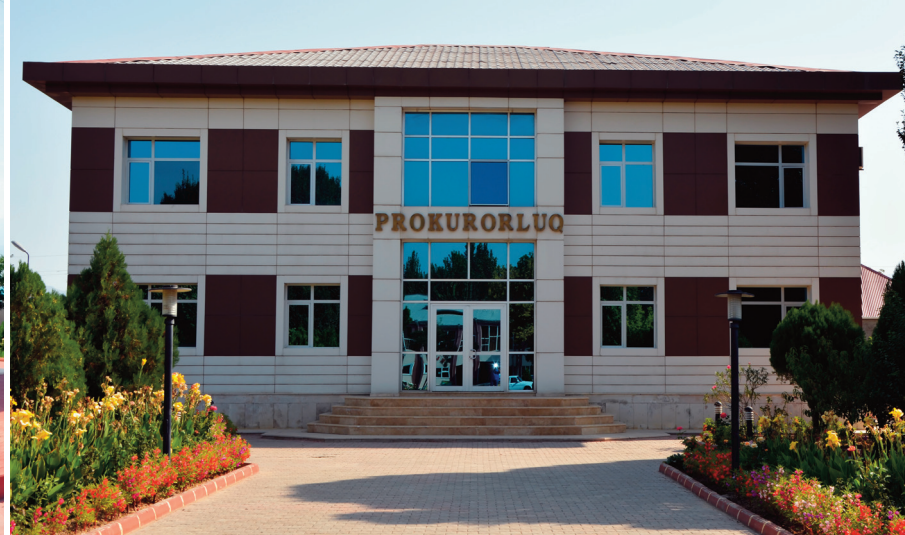
Şərur rayon prokurorluğunun inzibati binası