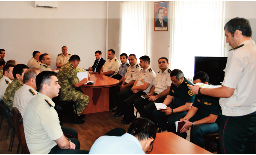
Gəncə hərbi prokurorluğunda keçirilmiş tədbirin iştirakçıları