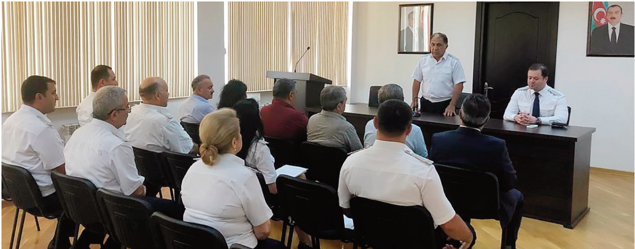
Bakı şəhəri, Sabunçu rayon prokurorluğunda keçirilmiş tədbirin iştirakçıları