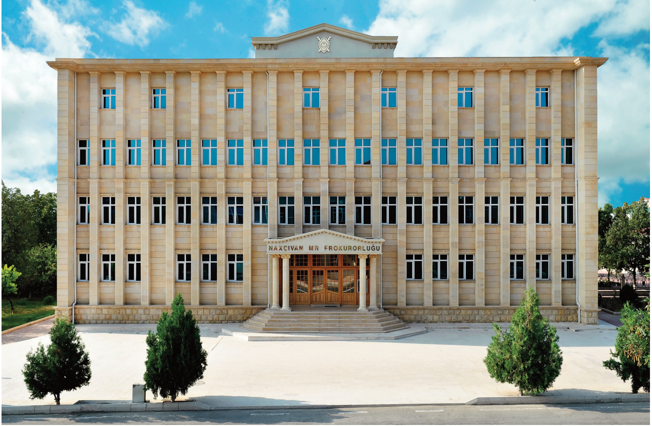
Naxçıvan Muxtar Respublikası Prokurorluğunun inzibati binası