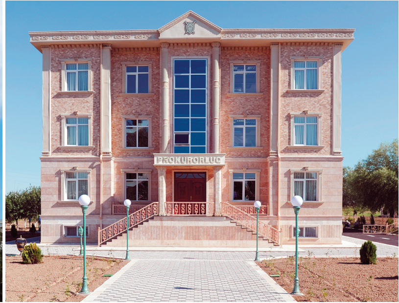
Babək rayon prokurorluğunun inzibati binası