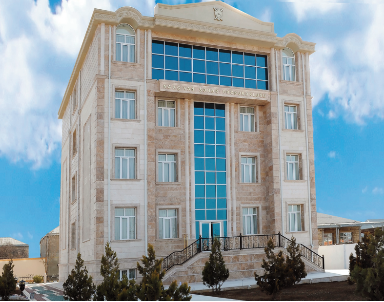
Naxçıvan şəhər prokurorluğunun inzibati binası