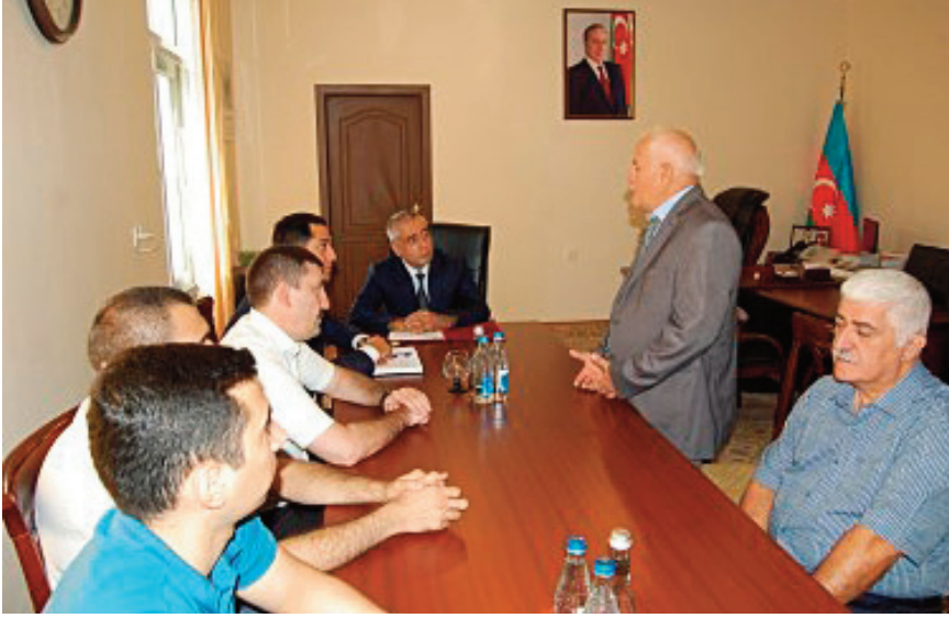
Bakı şəhəri, Binaqədi rayon prokurorluğunda keçirilmiş tədbirin iştirakçıları

olunub, rayon prokurorluqlarının bir sıra işçiləri rayon İcra Hakimiyyəti başçılarının fəxri fərmanları və xatirə hədiyyələri ilə təltif olunublar.