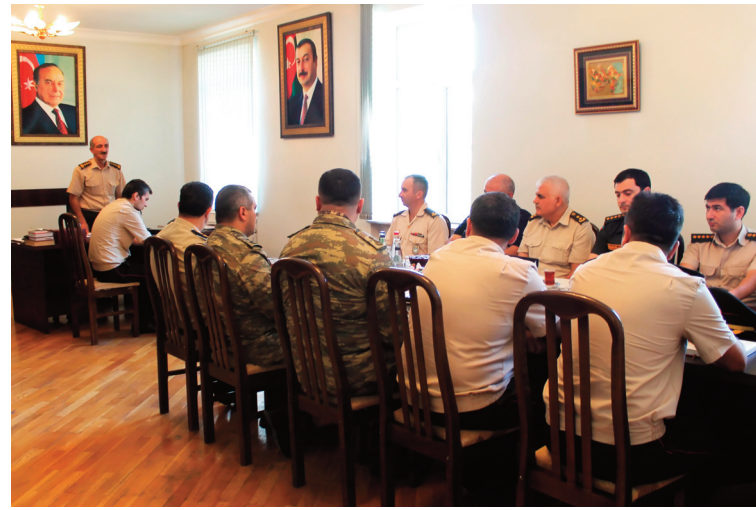
Sumqayıt hərbi prokurorluğunda keçirilmiş tədbirin iştirakçıları