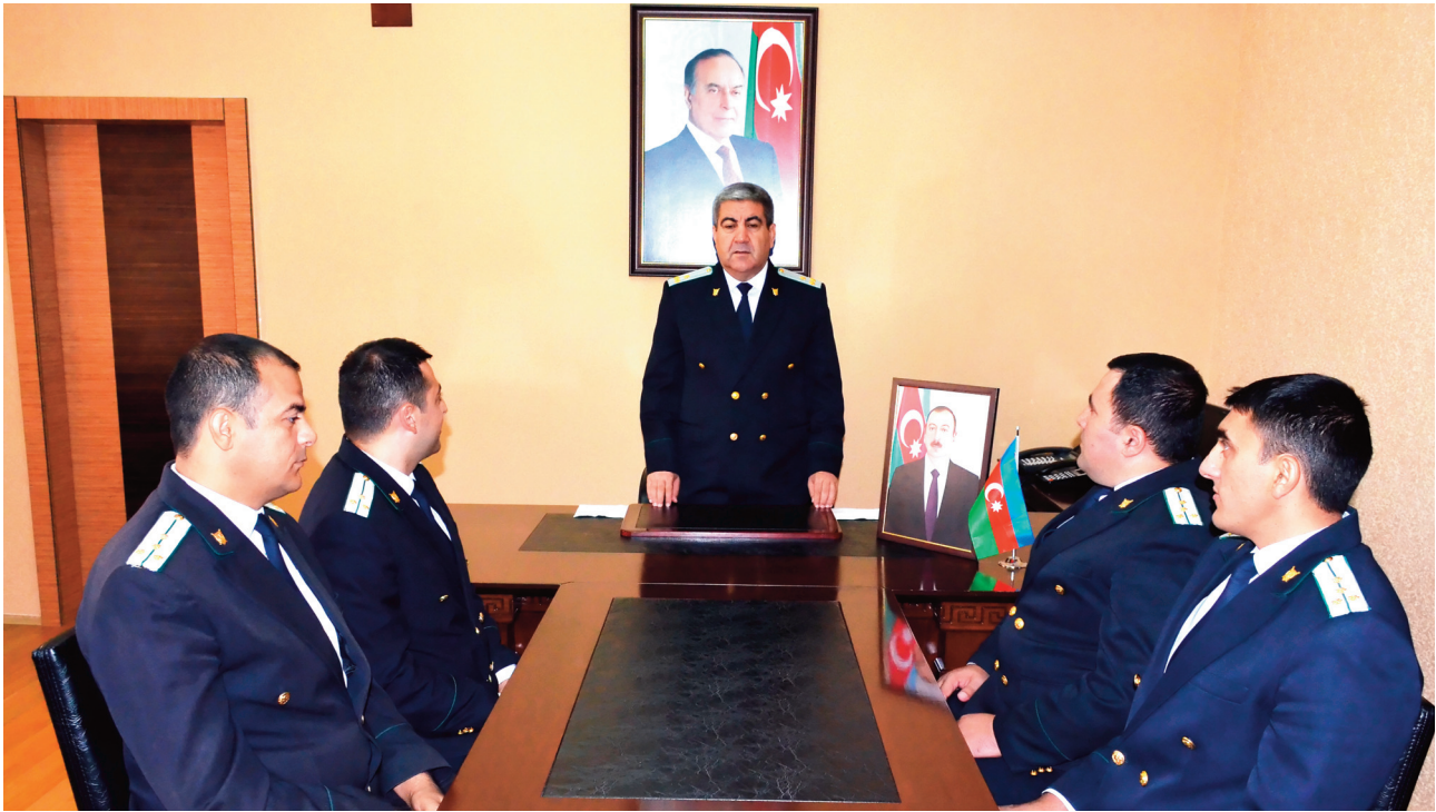
Babək rayon prokurorluğunda keçirilmiş tədbirin iştirakçıları

Tədbirlərdə Azərbaycan Respublikası Prokurorluğunun keçdiyi tarixi inkişaf yolu barədə məlumatlar verilib.