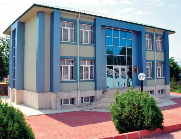
Ordubad rayon prokurorluğunun inzibati binası