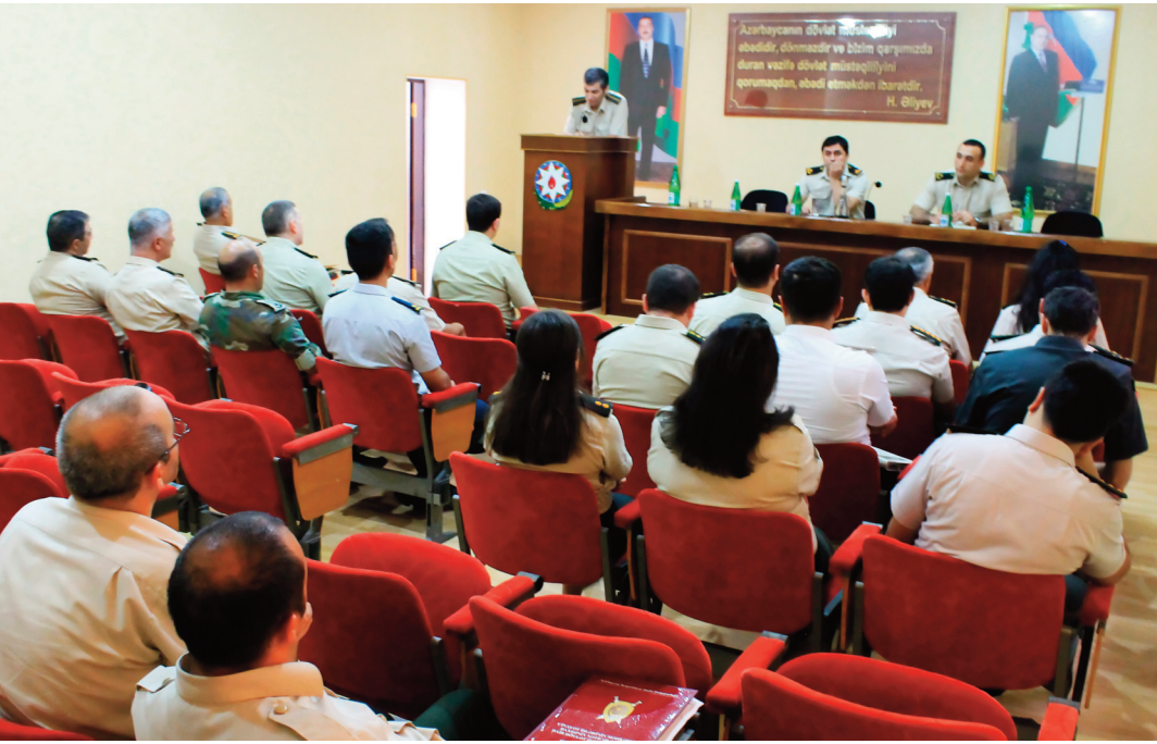
Bakı hərbi prokurorluğunda keçirilmiş tədbirin iştirakçıları