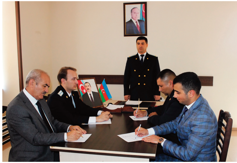
Ordubad rayon prokurorluğunda keçirilmiş tədbirin iştirakçıları