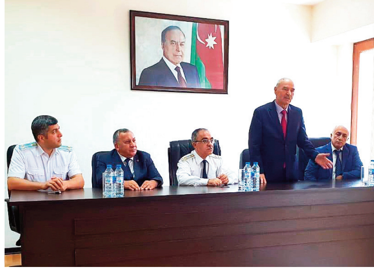
Bakı şəhəri, Yasamal rayon prokurorluğunda keçirilmiş tədbirin iştirakçıları