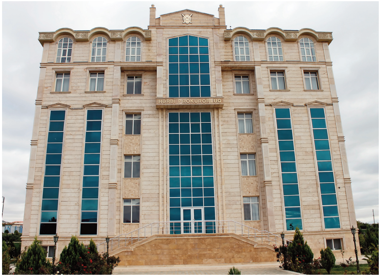
Naxçıvan Muxtar Respublikası Hərbi Prokurorluğunun inzibati binası