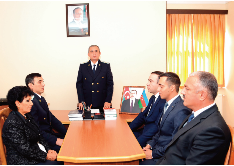
Culfa rayon prokurorluğunda keçirilmiş tədbirin iştirakçıları