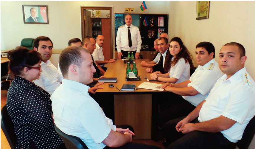
Bakı şəhəri, Suraxanı rayon prokurorluğunda keçirilmiş tədbirin iştirakçıları