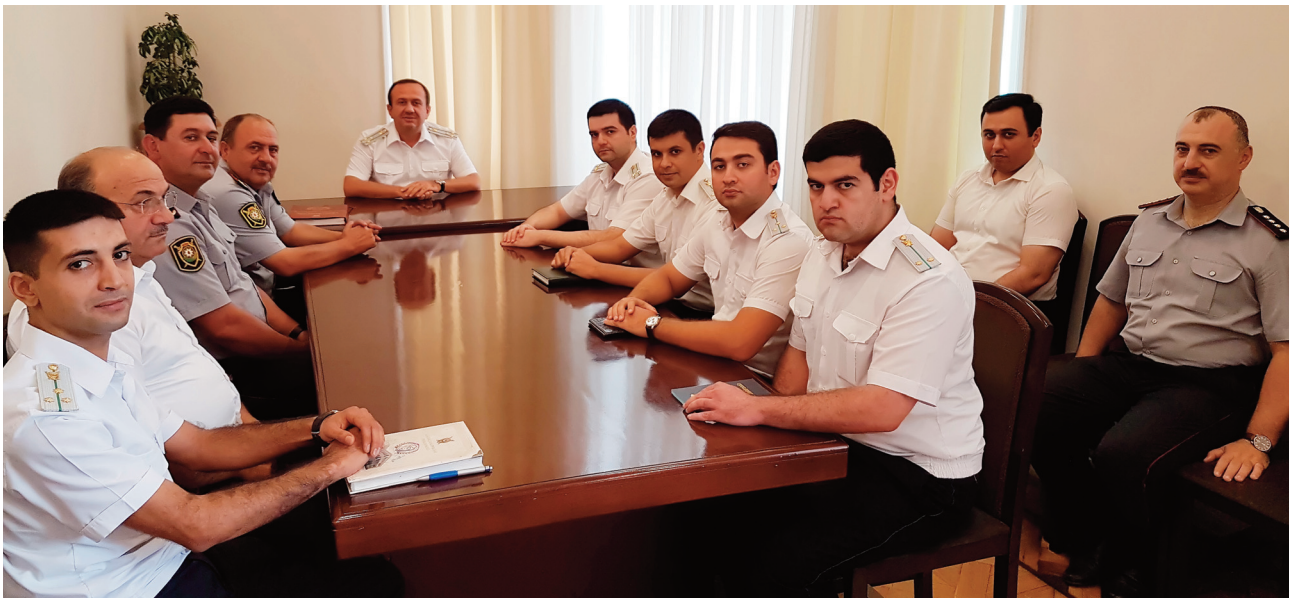
Bakı şəhəri, Səbail rayon prokurorluğunda keçirilmiş tədbirin iştirakçıları