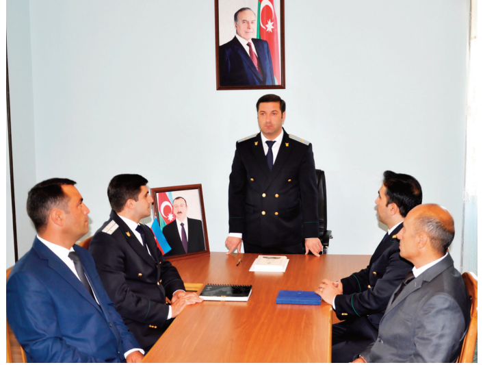
Şahbuz rayon prokurorluğunda keçirilmiş tədbirin iştirakçıları