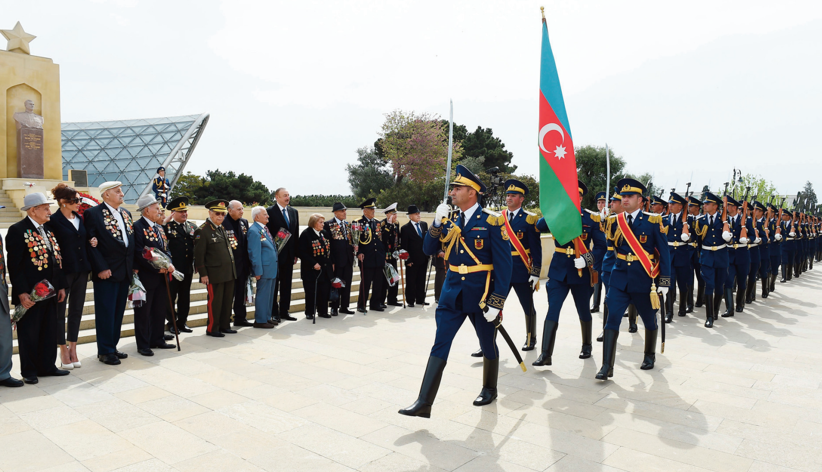
Mərasimdə Baş nazir Novruz Məmmədov, Milli Məclisin sədri Oqtay Əsədov, Prezident Administrasiyasının rəhbəri Ramiz Mehdiyev və digər rəsmi şəxslər iştirak edirdilər.