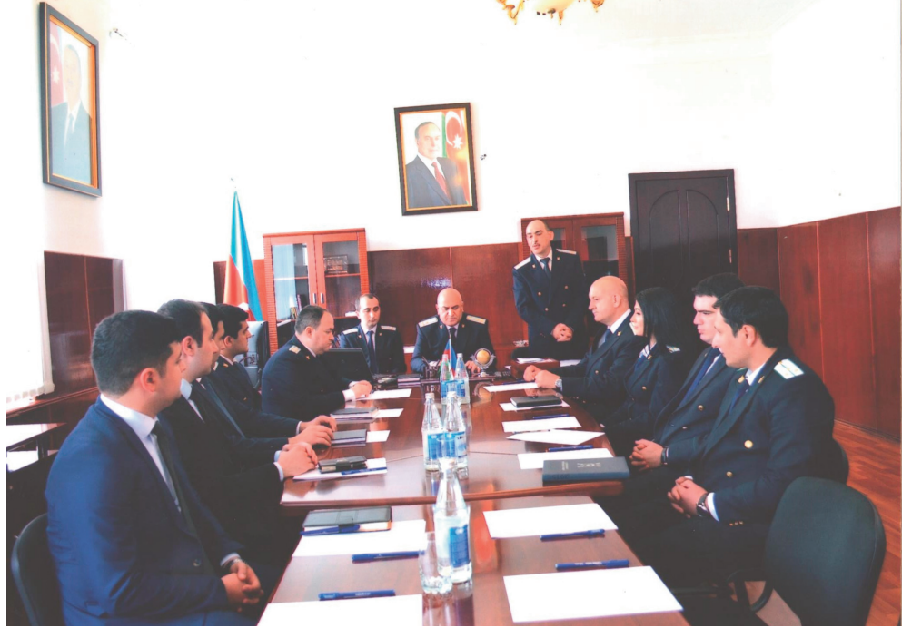
Kürdəmir rayon prokurorluğu

Avropa Şurası Nazirlər Komitəsinin, Avropa Prokurorları Məşvərətçi Şurasının funksiyaları, “İnsan hüquqlarının və əsas azadlıqların müdafiəsi haqqında” Avropa Konvensiyasının əsas müddəaları, insan hüquqlarının qorunması sahəsində beynəlxalq təcrübənin tətbiqi istiqamətində Azərbaycan dövləti və Prokurorluğu tərəfindən görülən işlər barədə məlumat vermişlər.