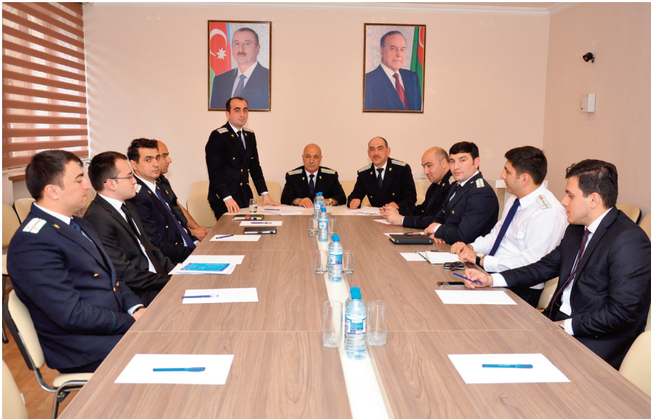
Zaqatala rayon prokurorluğu

Prokurorların cinayət mühakimə icraatı çərçivəsində vəzifələrinin yüksək səviyyədə yerinə yetirmələri, Avropa Şurasının demokratik prinsipləri və dəyərlərinə, təqsirsizlik prezumpsiyası, tərəflərin bərabərliyi prinsipinə, qərəzsiz və obyektiv olmalarına, etik davranışlarına riayət etmələri tövsiyə olunmuşdur.