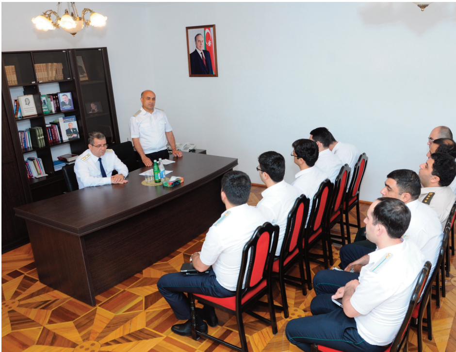
Astara rayon prokurorluğu

axtarışına, həbsinə, müsadirəsinə və terrorçuluğun maliyyələşdirilməsinə dair” Konvensiyanın müddəaları izah edilmişdir. Konvensiyanın ratifikasiyasından irəli gələrək cinayət yolu ilə əldə edilmiş pul vəsaitlərinin və ya digər əmlakın leqallaşdırılmasına və terrorçuluğun maliyyələşdirilməsinə qarşı mübarizə sahəsində Azərbaycanda qəbul edilən normativ hüquqi aktlar, milli fəaliyyət planları, görülən sistemli və ardıcıl tədbirlər barədə məlumat vermişlər.