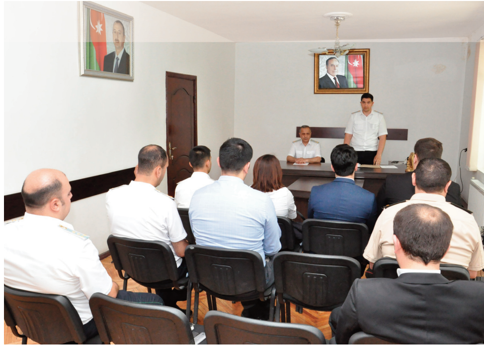
Beyləqan rayon prokurorluğu