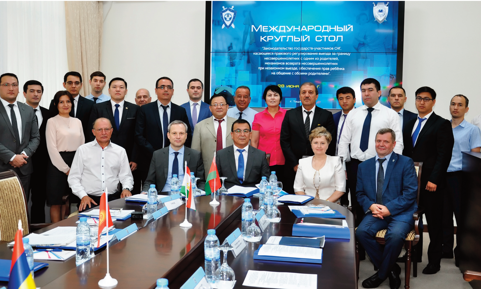
Baş Prokurorluğun Elm-Tədris Mərkəzi

Mövzunun aktuallığı nəzərə alınaraq bu sahədə təcrübə mübadiləsinin davam etdirilməsi qərara alınmışdır.