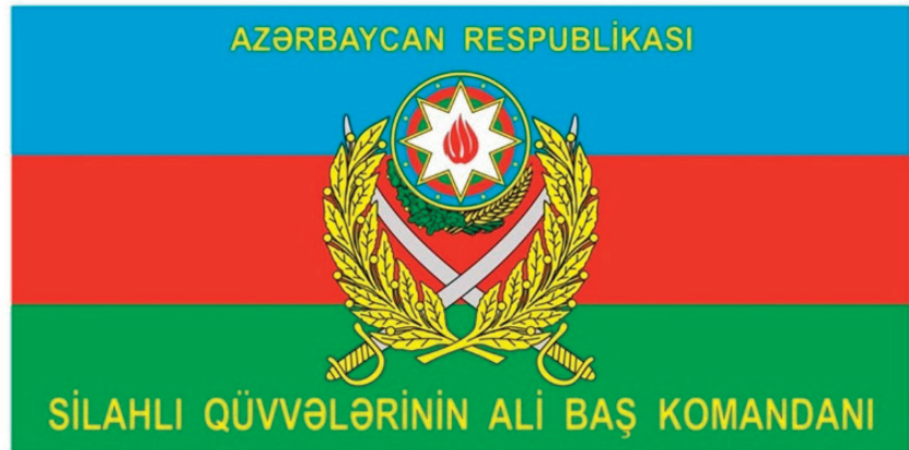
«Azərbaycan Respublikası Silahlı Qüvvələri Ali Baş Komandanının bayrağı»

«Azərbaycan Respublikası Silahlı Qüvvələri Ali Baş Komandanının bayrağının təsviri»nə əlavə